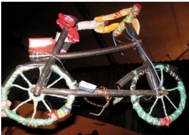
CLUB 213, division jeunesse d'Oxflam-Québec