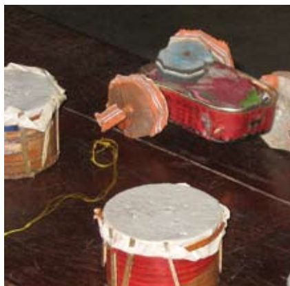
CLUB 213, division jeunesse d'Oxiham-Québec