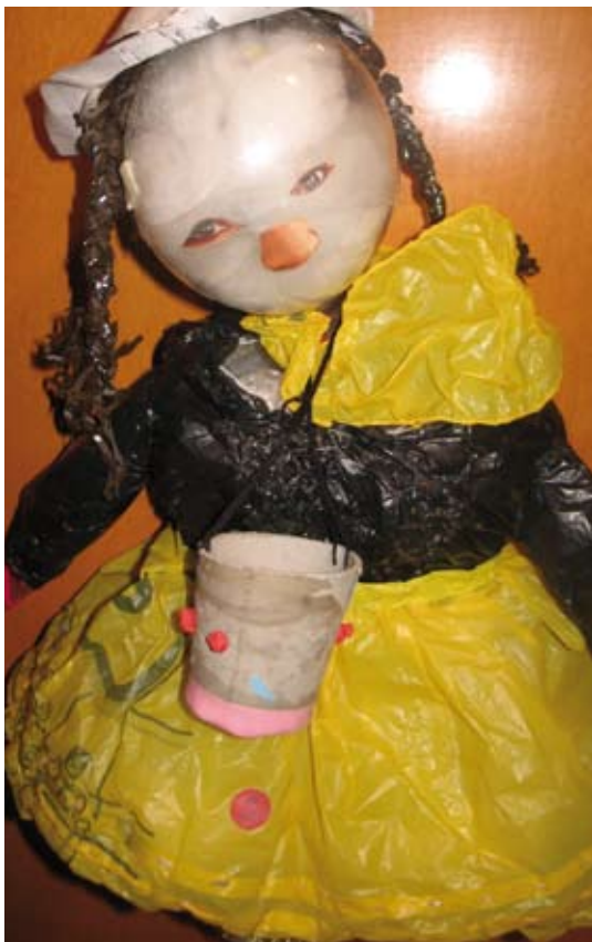
CLUB 213, division jeunesse d'Oxflam-Québec