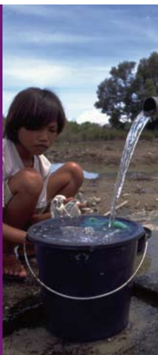
UNICEF HQ06-1011/Shezad Noorani

(Tiré du site www.leprodelacuisine.fr/recettes/24 )