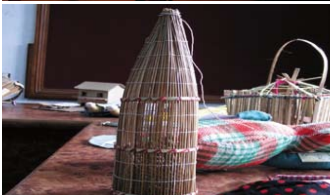
CLUB 213, division jeunesse d'Oxflam-Québec