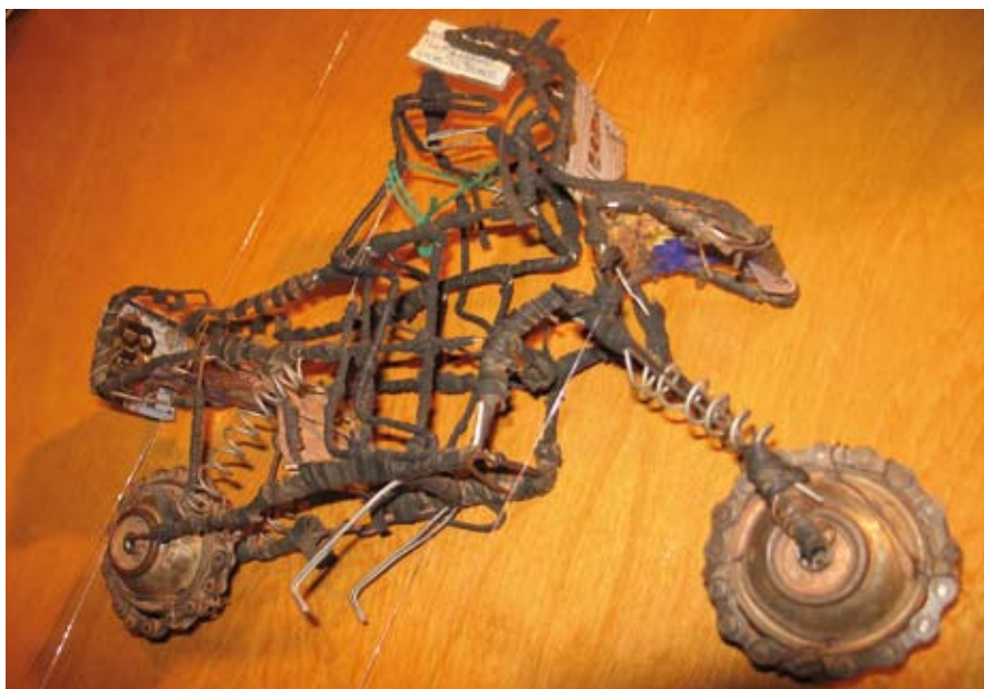
CLUB 213, division jeunesse d'Oxiham-Québec